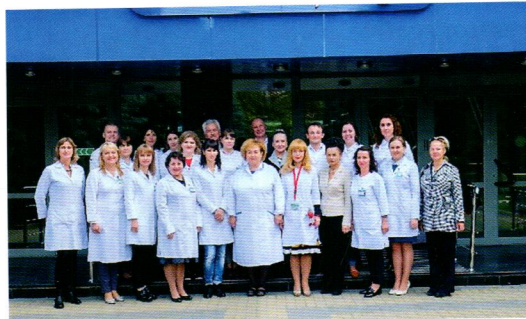
Colaboratorii Disciplinei de Reumatologie și Nefrologie

Direcțiile cercetărilor de astăzi sunt particularitățile evolutive ale poliartritei reumatoide seronegative, comorbiditățile în