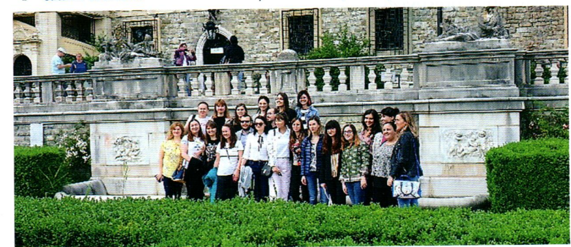
Școala de vară Sinaia 2019