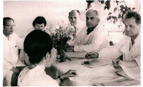
Exame la studenți și medici