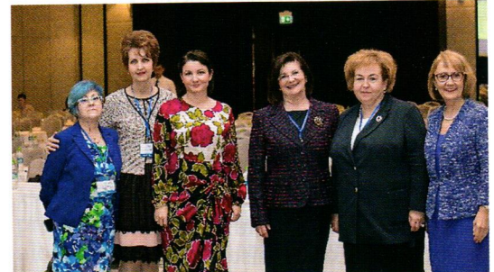
Lectorii conferinței moldo-române "Artrita psoriazică - o afecțiune cu valențe multiple"